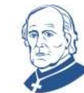
Bischof W. E. von Ketteler

Linie 107 von Deutscher Wetterdienst, Offenbach Ost (S-Bahn-Anschlussmöglichkeit)